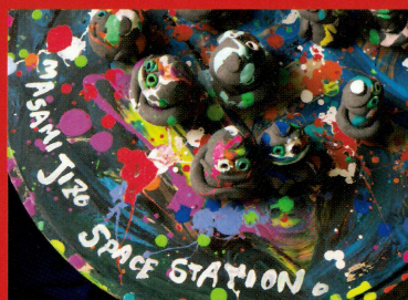
「MASAMI JIZO SPACE STATION」2025年