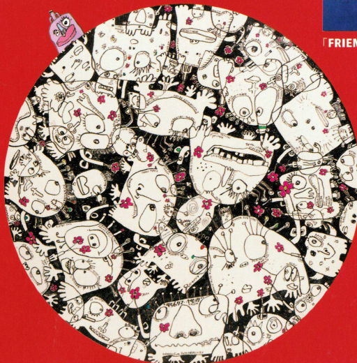
「イチリンザシファミリー」2025年